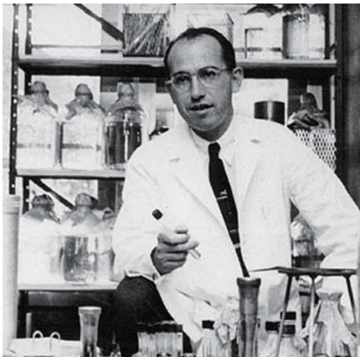
조나스 솔크 박사